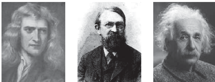
Obrázek 3: Isaac Newton, Ernst Mach a Albert Einstein (obr. převzaty z [7], [8], [9]).

Je všeobecně známo, že Machovy myšlenky měly velký vliv na A. Einsteina při vzniku obecné teorie relativity, zejména při formulaci principu ekvivalence gravitace a zrychlení. Např. v publikaci [3] je možno najít řadu Einsteinových pochvalných vyjádření zejména z období formulace myšlenek OTR. Není účelem tohoto příspěvku (ani v silách jeho autora) hodnotit, nakolik jsou Machovy ideje v soulase s OTR. 3 Jako velmi výstižné se mi jeví vyjádření J. Novotného v Úvodním slově k Einsteinově populární knížce [5]: